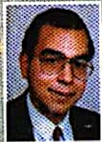
د. احمد خالد توفيق

الفرار ! .. الفرار ! .. الفرار من معالم شارعك .. من رائحة الأوراق على مكتبك .. الفرار من أصحاب الوجوه التي لا تتغير .. الفرار من ذكرياتك .. من همومك .. من كل من كانوا لك أعداء ، ومن كل من كنت لهم عدواً .. الفرار إلى عوالم الحلم .. إلى مدينة لم ولن توجد إلا فى مخيلة الحالمين مثلى ومثلك .. الفرار ! .. الفرار ! ..